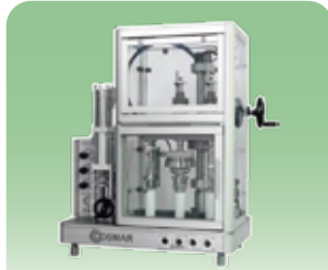
エアゾール半自動充填機 【ATLAS-1】